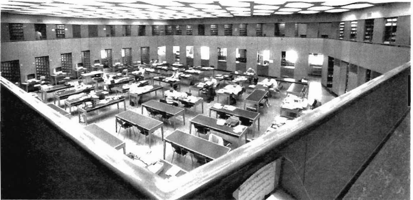
Auslagehalle des Deutschen Patentamtes: Für eine systematische Analyse technischer Informationen fehlen die Voraussetzungen